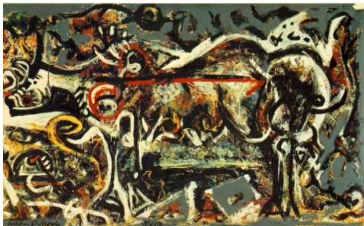
Εικόνα 1: Τζάκσον Πόλοκ, Λύκαινα

Ο Πόλοκ στο έργο «Λύκαινα» αναφέρεται στην γνωστή λύκαινα της ρωμαϊκής μυθολογίας, η οποία θήλασε τον Ρώμο και τον Ρωμύλο, τους ιδρυτές της Ρώμης. Το κεφάλι του ζώου είναι στραμμένο προς τα αριστερά, ενώ διακρίνονται αρκετά καθαρά οι παραφουσκωμένοι μαστοί (Leonard Emmerling, 2005 και Κρανός, 2008). Ορισμένοι υποστηρίζουν ότι ένα μέρος του σώματος παραπέμπει ίσως σε μαστόδοντο, επομένως δεν έχουμε να κάνουμε με λύκαινα αλλά με μειζογενές υβρίδιο, προϊόν της ένωσης δύο διαφορετικών ζώων (Emmerling, 2005). Η τάση του Πόλοκ να συσκοτίζει παρά να φωτίζει το εικονογραφικό περιεχόμενο γίνεται εντονότερη με τα χρόνια και θα κορυφωθεί κατά την περίοδο των τεράστιων πινάκων του (Emmerling, 2005 και Κρανός, 2008). Το περίγραμμα του σώματος της λύκαινας αποδίδεται με παχιές λευκές και μαύρες πινελιές (Emmerling, 2005 και Κρανός, 2008). Η τεχνική του είναι λάδι και γκούα, ενώ έχει προσθέσει και γύψο στις χρωστικές ουσίες για να ενισχύσει την αναγλυφικότητα και την πλαστικότητα των μορφών οι οποίες προβάλλουν μέσα από ένα συνονθύλευμα χρωμάτων και γραμμών (Emmerling, 2005).