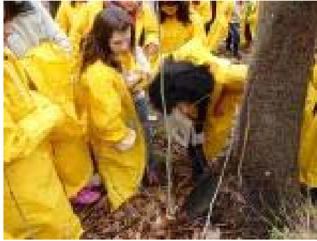
Ακόμα κι όταν βρέχει