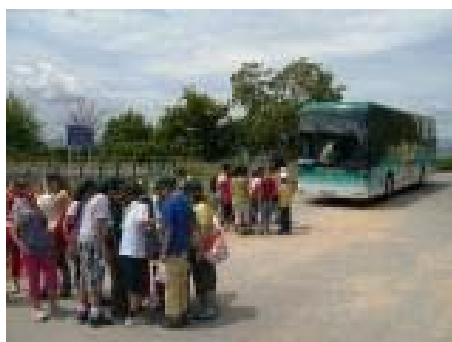
Προσανατολισμός στην είσοδο του φαραγγιού