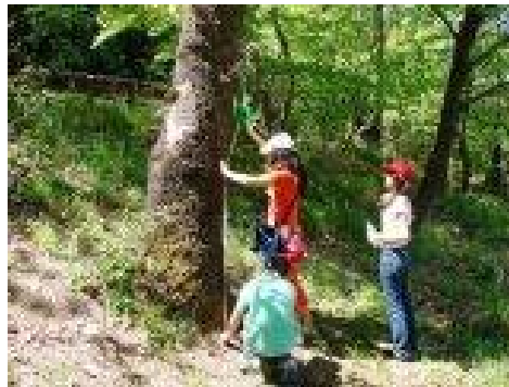
.. Η ταυτότητα του δέντρου