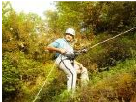
Βασικά μαθήματα καταρρίχησης