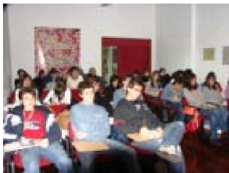
Υποδοχή στο ΚΠΕ και ενημέρωση για το πρόγραμμα

Φωτογραφικό υλικό από την υλοποίηση του προγράμματος « Λάφιστα, το φαράγγι των μύθων και των υδάτινων ήχων »