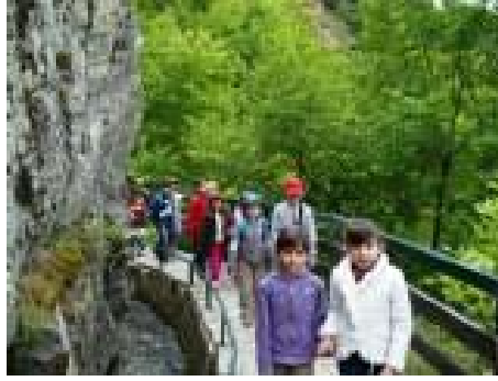
Στο μονοπάτι με προσοχή για την αναγνώριση δέντρων και θάμνων