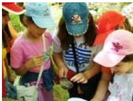
Τί ζει στο νερό και δεν φαίνεται με γυμνό μάτι;