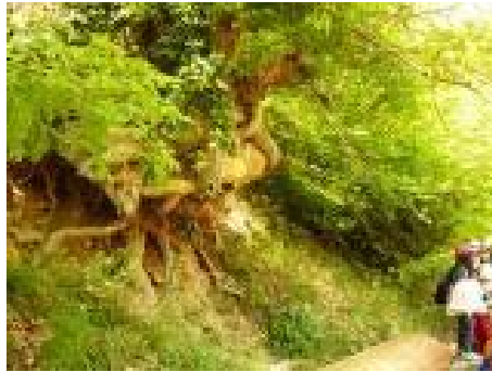
Παρατήρηση των αποτελεσμάτων της διάβρωσης