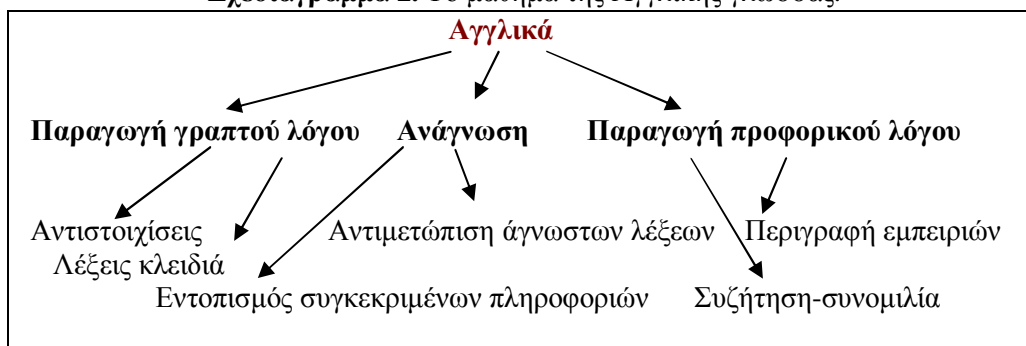
Σχεδιάγραμμα 2. Το μάθημα της Αγγλικής γλώσσας.

Για παράδειγμα, στο μάθημα των Αγγλικών, οι μαθητές κλήθηκαν να εκφράσουν γεγονότα, συναισθήματα και να περιγράψουν περιοχές και δραστηριότητες μέσα από την ξένη γλώσσα (Σχεδιάγραμμα 2.).