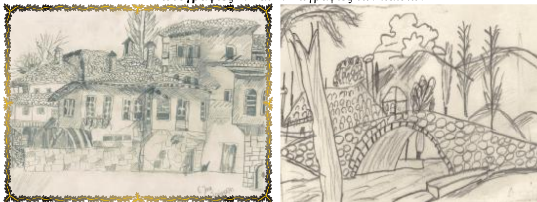
Φωτογραφίες 1. και 2. Ζωγραφίες των παιδιών

Επιπρόσθετα οι μαθητές κλήθηκαν να γίνουν «μικροί δημοσιογράφοι», να ασχοληθούν με μικροέρευνες. Δημιουργήθηκε έτσι το κατάλληλο κλίμα για τη διαθεματική προσέγγιση της εκπαιδευτικής διαδικασίας (Σχεδιάγραμμα 1.).