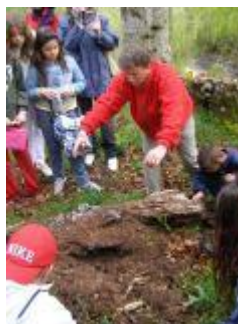
Εικόνα 7: Περιβαλλοντικά παιχνίδια και δραστηριότητες στο Δάσος