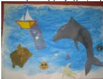
Εικόνα 6: Ομαδικό Έργο Ζωγραφικής

Τα παιδιά δημιούργησαν ομαδικά και ατομικά έργα ζωγραφικής , κείμενα και θεατρικά παιχνίδια.