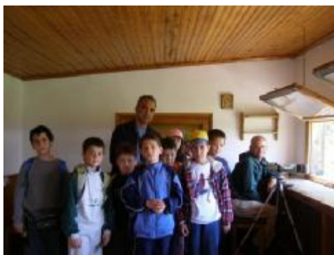
Εικόνα 8: Στο δάσος της Δαδιάς