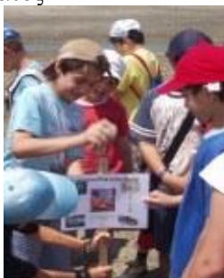
Εικόνα 9: Ανάρτηση πινακίδας στην παραλία