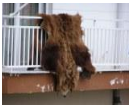
Εικόνα 4 : Δέρμα αρκούδας