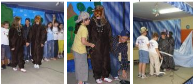
Εικόνα 10: Σκηνές από τα θεατρικά.