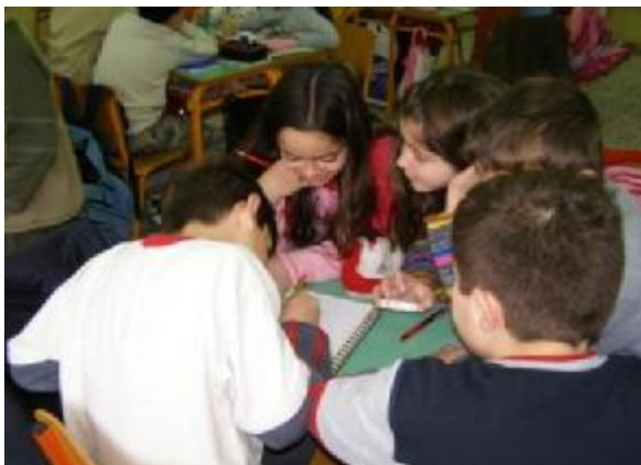
Εικόνα 2: Έρευνα στην τάξη

θέματος και τη συγκέντρωση πηγών πληροφόρησης . Ερευνήθηκαν βιβλία, άρθρα περιοδικών , δημοσιεύματα και το διαδίκτυο. Αναζητήθηκαν πρόσωπα ,οργανώσεις και υπηρεσίες που είχαν σχέση με το θέμα. Έγινε χωρισμός αρμοδιοτήτων τόσο σε επίπεδο τάξης όσο και σε ομάδων ,για καλύτερη μελέτη των Προστατευόμενων Περιοχών : υγρότοποι , εθνικοί δρυμοί , θαλάσσια πάρκα καθώς και των Απειλούμενων Ειδών : αρκούδα , λύκος , αρπαχτικά, μεσογειακή φώκια , δελφίνι , θαλάσσια χελώνα καρέττα καρέττα. Οι ομάδες εργάστηκαν παράλληλα ή με διαφορετική θεματική ,έχοντας στη διάθεσή τους κατάλληλο υλικό και φύλλα εργασίας που συγκεντρώθηκαν από την έρευνα.