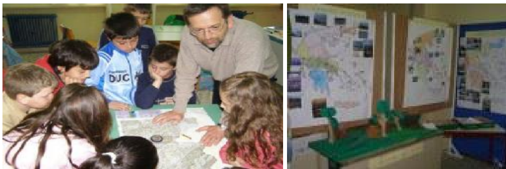
Εικόνα 3: Εργασία στο χάρτη, με τον Υπεύθυνο Π.Ε

Προβολή ταινιών με θέμα την αρκούδα ,του Αρκτούρου ,του National Geographic , της Disney , Ερευνητών και του Ζακ Ανώ.Υλοποίηση στην τάξη όλων των δραστηριοτήτων που περιλαμβάνει το Βαλιτσάκι της Αρκούδας του Αρκτούρος ,2005 & 2002 ) και αναφέρονται στη βιολογία , στη διατροφή ,στην εκπαίδευση των μικρών της , στις απειλές που δέχεται και κυρίως στον κατακερματισμό των βιοτόπων της .Επίσης ασχοληθήκαμε με το ζήτημα της αρκούδας χορεύτριας και την προστασία της.