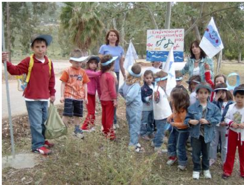
Φωτογραφία 1. Τοποθέτηση πινακίδας με περιβαλλοντικό σύνθημα