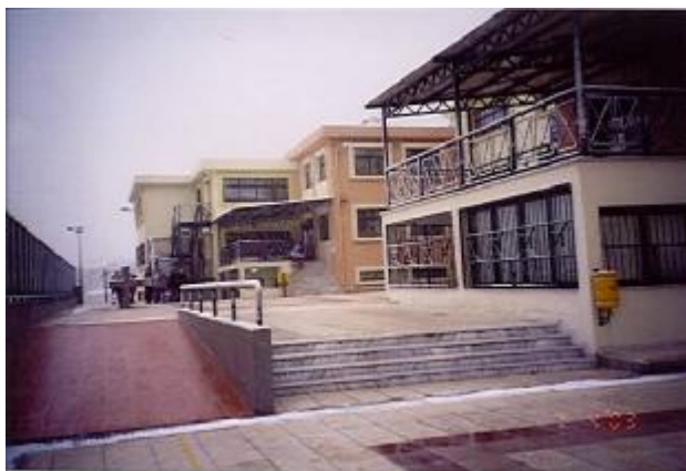
Φωτογραφία 3. Το Σχολείο μας

Όσον αφορά στο δεύτερο θέμα, «Το Σχολείο μας»: Το 1ο Γυμνάσιο Συκεών «Οδ. Φωκάς». Ιδρύθηκε το 1977. Μέχρι τότε οι μαθητές και οι μαθήτριες φοιτούσαν σε σχολείο στο κέντρο της Θεσσαλονίκης, όπου πήγαιναν με τα πόδια, φυσικά. Το οικόπεδο ήταν του Δήμου και το κτίριο δωρεά των αδελφών Φωκά, προσφύγων από το Βατούμ της Ρωσίας, στη μνήμη του αδερφού τους Οδυσσέα, όπως γράφει και η αναρτημένη πινακίδα στο παλιό διδακτήριο, επί της οδού Οδ. Φωκά.