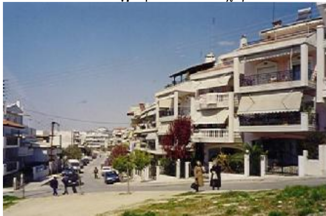
Φωτογραφία 1.Το Ροδοχώρι

Όμως η γεωγραφική θέση του Δήμου έχει πολλά πλεονεκτήματα. Απλώνεται στο βουνό, σε μικρή απόσταση από το κέντρο της Θεσσαλονίκης, με θέα μοναδική προς τον Θερμαϊκό και το δάσος του Σείχ Σου και με ωραίο κλίμα. Έχει τη δεντροφυτεία που είναι ένας πνεύμονας πράσινου και χώρος αναψυχής. Ως εκ τούτου, τα τελευταία 20 χρόνια, και λόγω της προαστιοποίησης της Θεσσαλονίκης, η ανοικοδόμηση είναι ραγδαία. Ο πληθυσμός αυξάνεται με ταχείς ρυθμούς. Διαθέτει πλέον και γειτονιές καινούριες, πανάκριβες, με πολυτελείς οικοδομές, με πάρκα και γήπεδα τένις, καθώς προσελκύει επίσης νεόπλουτους και μεγαλοαστούς. Έτσι, η περιοχή των Συκεών έχει αλλάξει πολύ από τις αρχές του περασμένου αιώνα. Ελάχιστα θυμίζουν τον τόπο που εγκαταστάθηκαν οι πρόσφυγες.