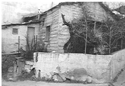
Φωτογραφία 2. Η ... παράγκα.

Σύμφωνα με την απογραφή του 2001 έχει 41.726 κατοίκους, αλλά ο πραγματικός πληθυσμός είναι πάνω από 60.000 χιλιάδες. Σ' αυτούς πρέπει να υπολογίσουμε τους 4.000 περίπου «νεοπρόσφυγες», που ήρθαν από την πρώην Σοβιετική Ένωση, στα τέλη του 20ου αι. Οι Συκιές δέχτηκαν και 1100 περίπου αλλοδαπούς οικονομικούς μετανάστες, κυρίως από Αλβανία. Τα παιδιά τους είναι μαθητές μας, συμμαθητές και συμμαθήτριες των Ελλήνων μαθητών και μαθητριών.