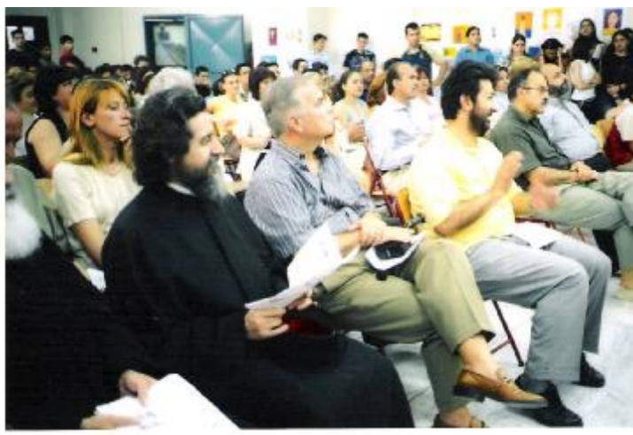
Φωτογραφία 4. Από την τελική εκδήλωση (τοπικοί άρχοντες, πολίτες, μαθητές/τριες)

Το ΚΠΕ Ελευθερίου – Κορδελιού συντόνιζε το Δίκτυο «Τοπική Ιστορία και Π.Ε.», στο οποίο συμμετείχαμε.