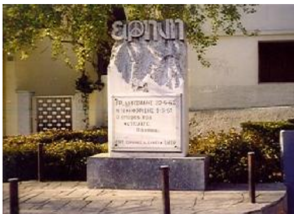
Φωτογραφία 9. Το «μνημείο της Ειρήνης»

Αφιερωμένο στους δολοφονημένους αγωνιστές της ειρήνης, τον βουλευτή Γρηγόρη Λαμπράκη και το νεαρό Νίκο Νικηφορίδη, που το 1950, ενώ συγκεντρώνει υπογραφές για την ειρήνη, συλλαμβάνεται, βασανίζεται και φυλακίζεται. Το έκτακτο στρατοδικείο τον καταδικάζει σε θάνατο. Εκτελέστηκε στις 5 Μαρτίου 1951. Ήταν 23 ετών!