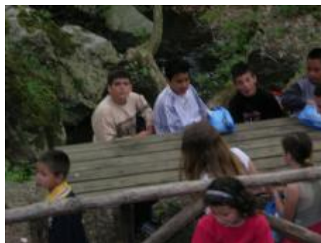
Εικόνα 14. Ώρα για ξεκούραση και κολατσό