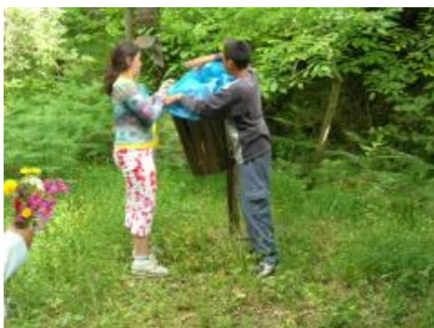
Εικόνα 13. Με σεβασμό στη φύση