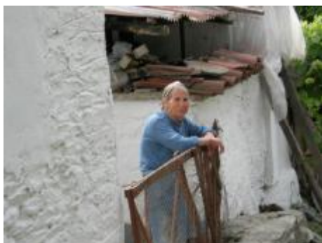
Εικόνα 7. Η γιαγιά επιμένει ευτυχισμένη ....