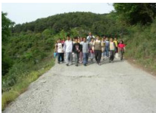
Εικόνα 4. Από τον ασφαλτόδρομο στον χαλικόδρομο