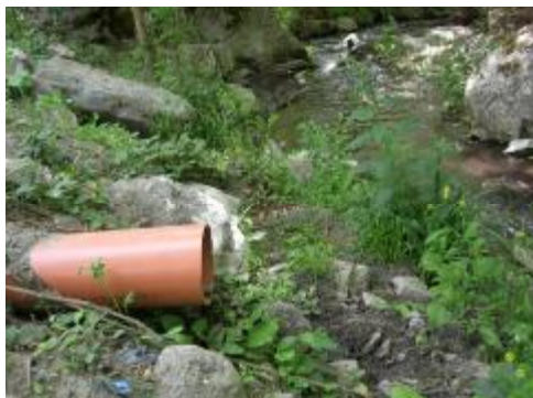
Εικόνα 9. Απορροή ομβρίων