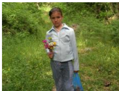
Εικόνα 12. Συγκέντρωση ποικιλίας λουλουδιών