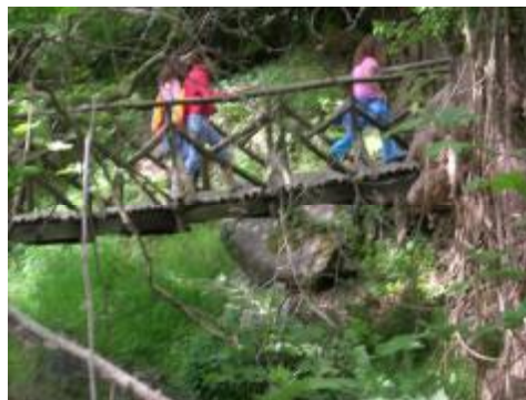
Εικόνα 10. Ξύλινο γεφύρι στο ρέμα