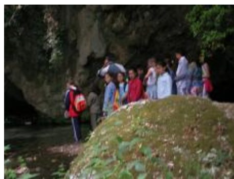
Εικόνα 16. Τη βρίσκουν άραγε φτωχική την Ιθάκη;