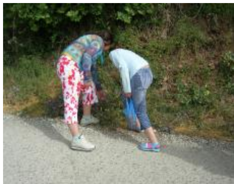
Εικόνα 5. Συλλογή λουλουδιών