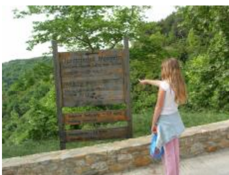
Εικόνα 3. Σήμανση σε ξύλινο ταμπλό