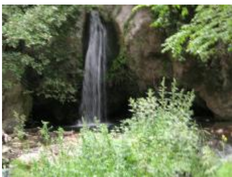
Εικόνα 15. Η Ιθάκη της διαδρομής