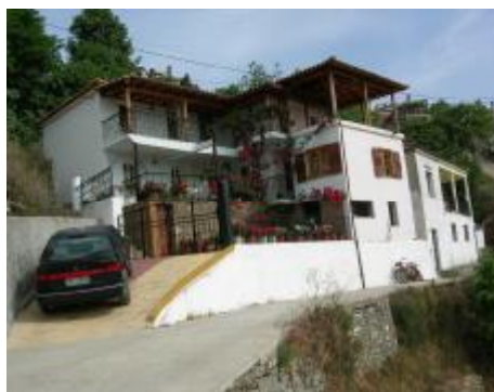
Εικόνα 6. Σύγχρονη οικοδομή πλάι στο μονοπάτι