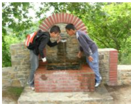
Εικόνα 2. Βρύση στην αρχή της διαδρομής