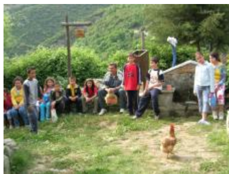
Εικόνα 8. Μια στάλα .....ανάσας