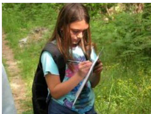
Εικόνα 11. Συμπλήρωση ερωτηματολογίου